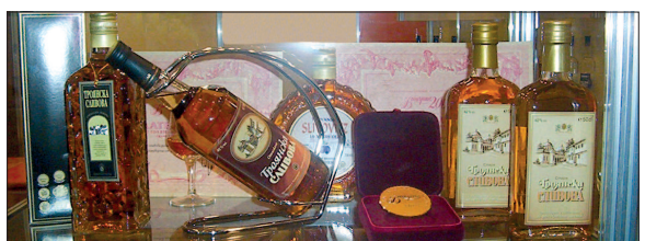
Na mezinárodním veletrhu v Plovdivu získaly výrobky Vinpromu Trojan opět zlatou medaili.

uvedené tradiční značky „trojanská“ a „tetevenská“ švestková rakija a uplatňovat úspěšné marketingové a obchodní strategie z jiných evropských trhů, působením lokálním zvyklostem. Primárním cílem bude využití vysoké známosti a oblíbenosti bulharských ovocných destilátů, zejména slivovice, u domácích spotřebitelů a podpořit jejich konzumaci na tammím trhu.