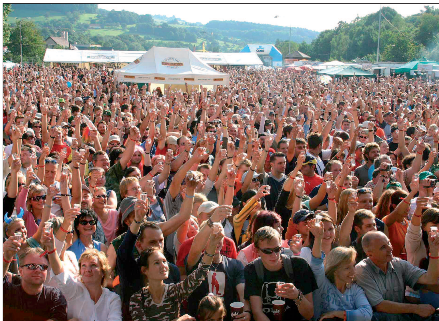
Rekord v hromadném přípitku slivovicí byl ustanoven na Vizovickém trnkobraní 2006

Dva roky po vzniku sporu mezi Agenturou Publikum na straně jedné a společností RUDOLF JELÍNEK a Kulturně společenským sdružením Vizovické trnkobraní na straně druhé, došlo ke vzájemné dohodě všech zúčastněných stran.