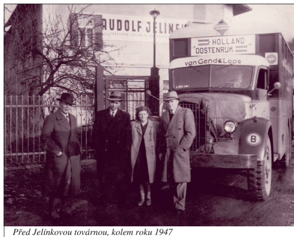
Před Jelínkovou továrnou, kolem roku 1947

K výrazné změně došlo po komunistickém převratu v roce 1948. I když studená válka padesátých let proti sobě postavila dva nesmiřitelné politické bloky, neznamenalo to, že země oddělené železnou oponou spolu přestaly obchodovat. Jelínkova slivovice byla na Západě nadále vyhlášená a stát její vývoz trvale podporoval. Vizovická firma byla znárodněna, stále však na etiketách používala jméno bývalého majitele. Vývoz byl řízen státem prostřednictvím tzv. Centrokómise, později transformované v podnik zahraničního obchodu Koospol. Dojednány byly zakázky, uzavřeny smlouvy či propagace byly plně v ruce Koospolu. S trochou zjednodušení by se