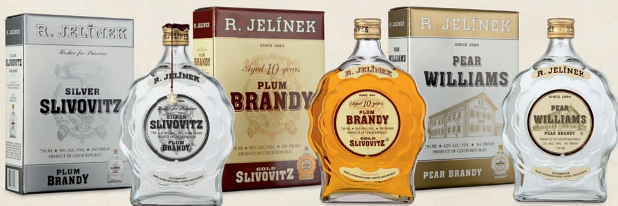
Stávající design kosher produktů.