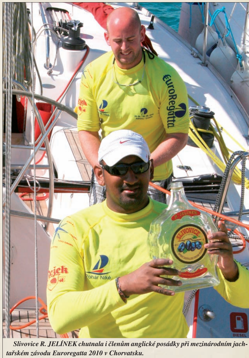
Slivovice R. JELÍNEK chutnala i členům anglické posádky při mezinárodním jachtařském závodě EuroRegatta 2010 v Chorvatsku.

Zemětřesení je jedním z přírodních zúkazů, které stávající stav vědy a techniky neumí předpovídat. Proto i letošní velmi silné zemětřesení překvapilo Chilaně (včetně nás) v časně sobotní ráno o posledním prázdninovém víkendu.