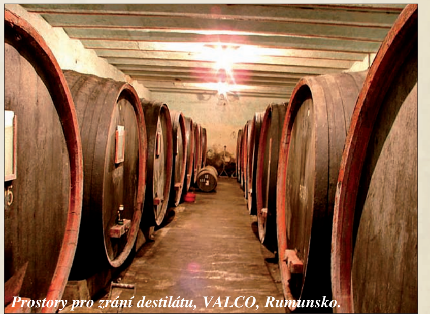
Prostory pro zrání destilátu, VALCO, Rumunsko.

Firma VALCO má dlouholetou tradici ve výrobě alkoholických nápojů. Vznikla transformací ze státem vlastněného podniku VIN-ALKO, který v době socialismu tvořil páteří síť rumunských výrobců alkoholu. Ve městě SEINI společnost produkuje (je zde kvasírna, pálenice, stáčírna a také sklad hotových výrobků) nejen ovocné destiláty (slivovice a jablečnice), ale také zde vyrábí z dodaných polotovarů licenční výrobky nizozemské firmy UTO, která je také významným spoluvlastníkem společnosti. Samotný obchod se realizuje z pobočky, která má sídlo v Bukurešti.