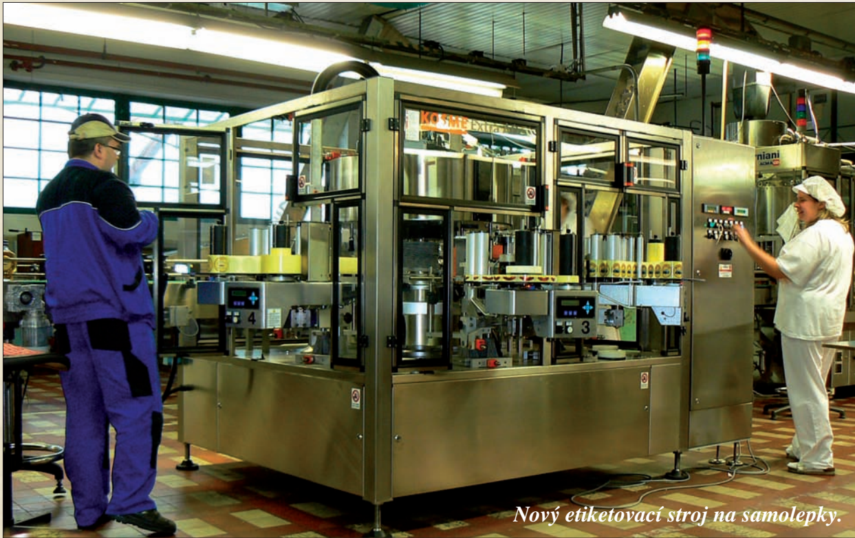
Nový etiketovací stroj na samolepky.