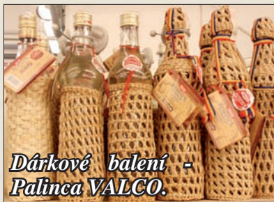
Dárkové balení - Palínka VALCO.

o více než 90 %). Ovocné destiláty se v Rumunsku dělí do několika skupin vždy dle