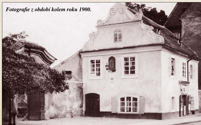
Fotografie z období kolem roku 1900.

T ento záměr se 10. října 2017 konečně dostal do fáze pravomocného stavebního povolení. Zároveň byl vybrán zhotovitel stavby, kterým je ENERGIE stavební a báňská a.s. Společnost má mnoho zkušeností s prováděním staveb pod zemí i se stavbami přímo na Praze 1. Zahájili jsme první fázi bouracích prací včetně dokončení archeologického průzkumu a od začátku prosince bude zahájena samotná stavba, která bude trvat minimálně jeden rok. Pokud vše půjde, předpokládáme zahájení provozu nejpozději do Vánoce 2019.